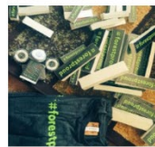
Sticker Packs $15.00 - $32.00