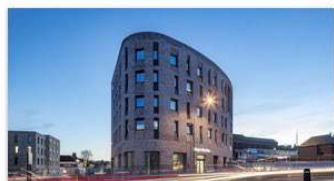
106 Lewes Road Brighton