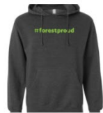
Sweatshirt *Limited stock! $35.00