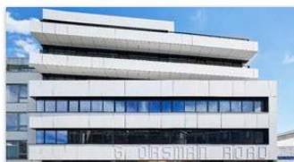
6 Orsman Road London