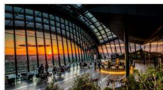
20 Fenchurch Street, Canary Wharf London