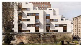
81-87 Weston Street Southwark, London

A flexible and recyclable workspace in the heart of Hackney