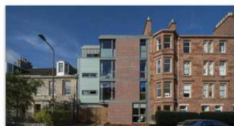
26 Bath Street Edinburgh