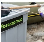
Large sticker $3.50