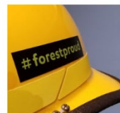
Small sticker $1.50