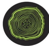
Tree Rings Sticker $1.50